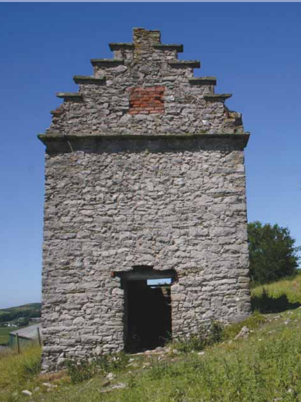
Dovecote, Gop Hill Colomendy, Bryn Gop

4. Turn L, then L again at junction to go over stile R beside 'Clarence House' driveway. Follow ODP ahead thro' 4 fields down to quiet lane. Follow ODP L, after 200m cross stile/gate on RHS. Head up field and down next to reach A5151. Turn R, then cross road and stile opposite. Follow path to road. Turn R down road past cottages. Follow ODP, passing Trout Farm on L, to reach Marian Mill.