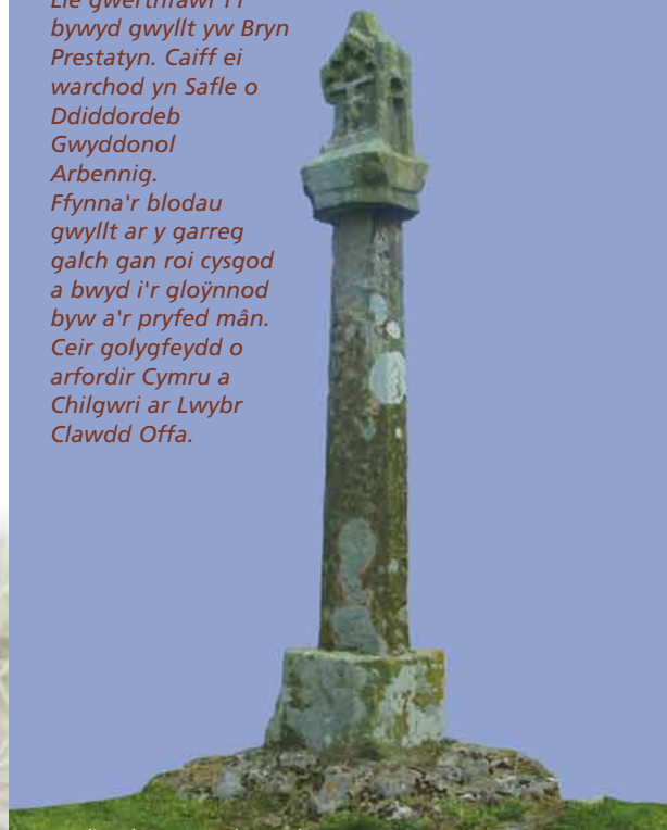
Medieval Cross, Trelawnyd Y Groes Ganoloesol, Trelawnyd

Ffynna'r blodau gwyllt ar y garreg galch gan roi cysgod a bwyd i'r gloŷnnod byw a'r pryfed mân. Ceir golygfeydd o arfordir Cymru a Chilgwri ar Lwybr Clawdd Offa.