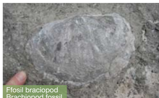
Ffossil braciopod Brachiopod fossil

The Leete Path follows the route of a man-made water channel that was built in 1824 to bypass the swallow holes in the river and maintain a constant supply of river water to the waterwheels along the valley. The waterwheels drove pumps which drained water from the mines.