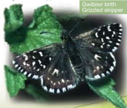
Gwibiwr brith Grizzled skipper

Woodland glades are buzzing in summer, with grasshoppers, bees and butterflies such as green hairstreaks and the rare grizzled skipper.