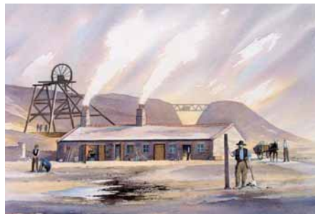
Veins of lead were mined in the 19th century. Ruined mine buildings still remain in the forest.

O'r paneli mwyngloddio, cadw'r hen adeiladau mwyngloddio ar eich LIDD a chymryd y llwybr drwy'r coed conifer sydd ar y LlCh, yn union ar ôl y panel. Croesi'r gamfa wrth ymyl goedwig ac i mewn i'r cae sydd â llyn mawr ar y LIDD. Cerddwch yn groesgornel i'r Ch ar draws y cae a dros y gamfa risiau. Dal ymlaen ar draws y cae nesaf a dros gamfa risiau arall. Cerdded ar draws y cae a chroesi'r gamfa sydd yn y gornel Ch bell, yna dilyn ffin LlCh y cae drwy ddau gae arall. Croesi'r gamfa yng nghornel Ch y cae, bydd fferm ar y LIDD. Cerdded ar hyd y dreif i'r ffordd. Croesi'r ffordd a throi i'r Ch ac wedyn i'r Dd ar unwaith dros gamfa/giât, (arwydd Bryn Alun). Dilyn y llwybr llydan amlwg o'ch blaen, dal ymlaen wrth i'r llwybr ddisgyn i bant, bydd creigiau calchfaen ar eich LIDD. Dal ymlaen i'r un cyfeiriad nes dod at y palmant calch. Mae golygfeydd gwych i Foel Famau. Mae hwn yn dir mynediad ac mae hawl i grwydro gennyh.