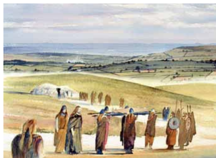
4000 years ago Bronze Age people lived here in simple farming communities. They built a stone cairn on the hillside as a place to bury their dead.

Bu cloddio'r gwythiennau plwm yn ystod yr 19eg ganrif. Mae adfeilion hen adeiladau'r gwaith plwm i'w gweld yn y goedwig o'r hyd.