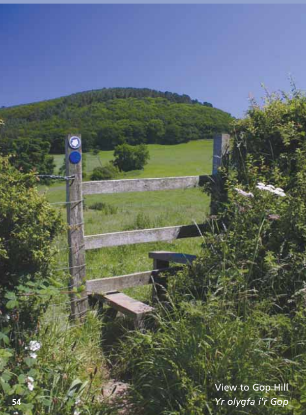
View to Gop Hill Yr olygfa i'r Gop

6. Follow road R into Gwaenysgor. (NB Busy