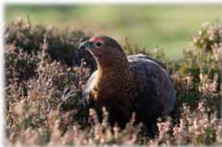
Grugiar goch / Red Grouse

4. Just beyond the last houses on the left take the footpath left, signposted Corwen. At the end of the track cross the stile and follow the path ahead keeping the old hedge on the left. Cross another stile beside a gate then turn right and walk along the old railway line. Go through a gate beside a house and continue along the old railway line with the river on your left, passing the white Llangar church on the right and a birdhide converted from an old railway hut. Cross a stile into the grounds of a riverside house and follow the path across the lawn keeping close to the river. Cross the stile in the left corner of the fence at the end of the lawn and join the track ahead. After 50m turn left onto a waymarked path through trees to the road. Go over stile and carefully cross the main road and walk along the pavement, following the road sign to Corwen. Walk into the town centre and turn left back to the car park.