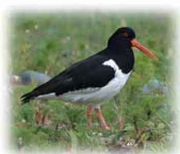
Pioden Fôr / Oystercatcher